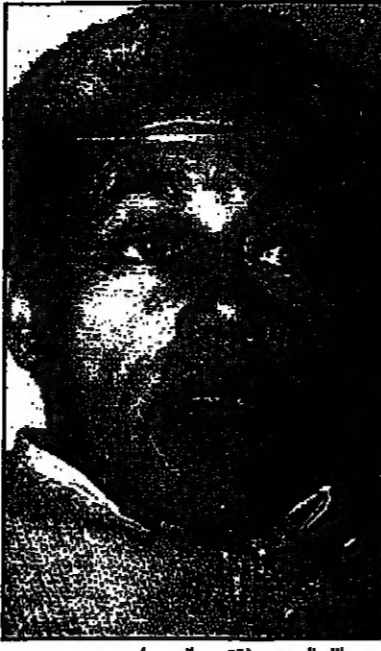
أحمد حجار (القدس العربي)

ويضم المعرض 60 جناحا، بعضها مشترك بين عدة ناشرين، و200 ناشر من فرنسا واوروبا والشرق العربي، ويخاض المجلات احدثى على 30 مجلة عربية واوربية، والبرامج والبرامج العربية والاسلامية، إضافة الى جناح خاص بالناظر والاشبه. والناشر العربي للبرامج والبرامج العربية والاسلامية، إضافة الى جناح خاص بالناظر والاشبه. والناشر العربي للبرامج والبرامج العربية والاسلامية، إضافة الى جناح خاص بالناظر والاشبه.